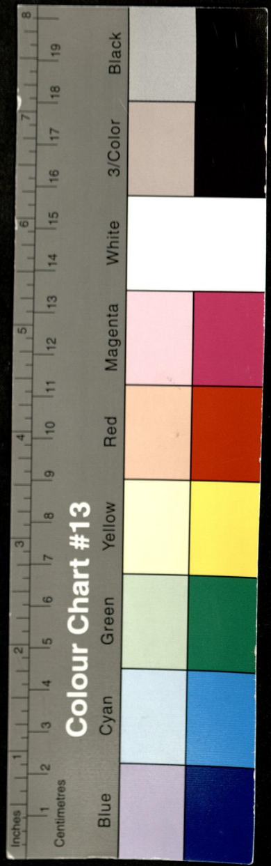
Colour Chart #13

Inches 1 2 3 4 5 6 7 8 9 10 11 12 13 14 15 16 17 18 19 Centimetres