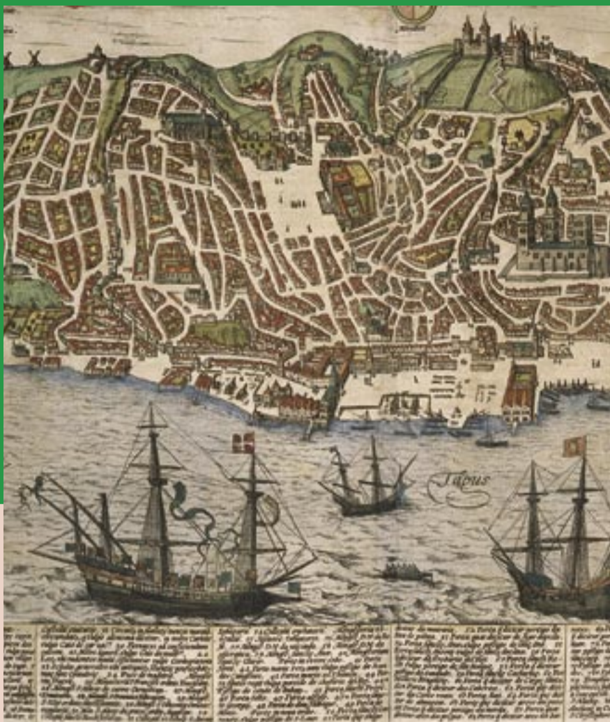
Darstellung Lissabons aus dem Städteatlas Civitates orbis terrarum von Georg Braun und Franz Hogenberg (6 Bände, Köln/Antwerpen, 1572–1617)