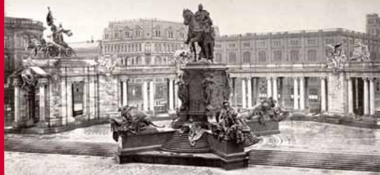
Berlin, Kaiser Wilhelm-Nationaldenkmal, Fotografie um 1900

Deutsches Historisches Museum 22. Januar 2010