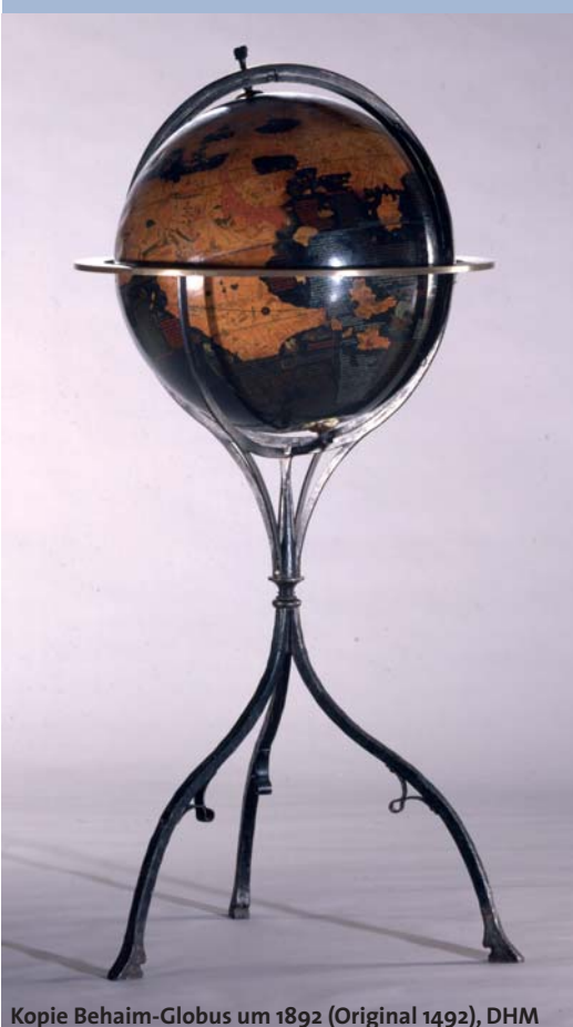
Kopie Behaim-Globus um 1892 (Original 1492), DHM

19.30 – 23.00 Treffpunkt Restaurant Nolle Am S-Bahnhof Friedrichstraße, Georgenstraße Tel.: 208 26 45, www.restaurant-nolle.de Tische sind reserviert