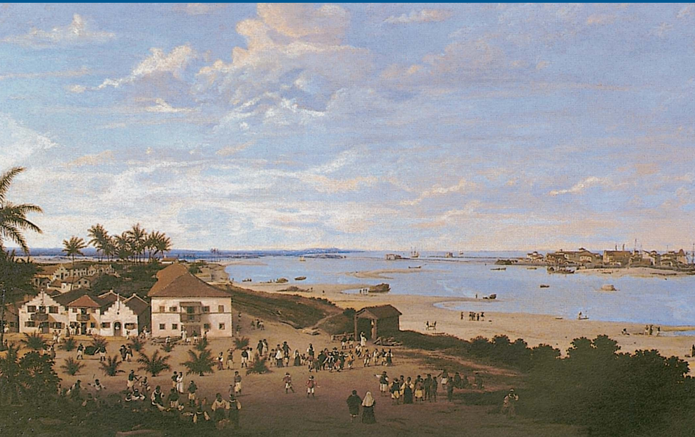
Frans Post (1612-1680): Mauritsstad und Recife

12.-14. Juni 2009 Deutsches Historisches Museum · Berlin Zeughauskino