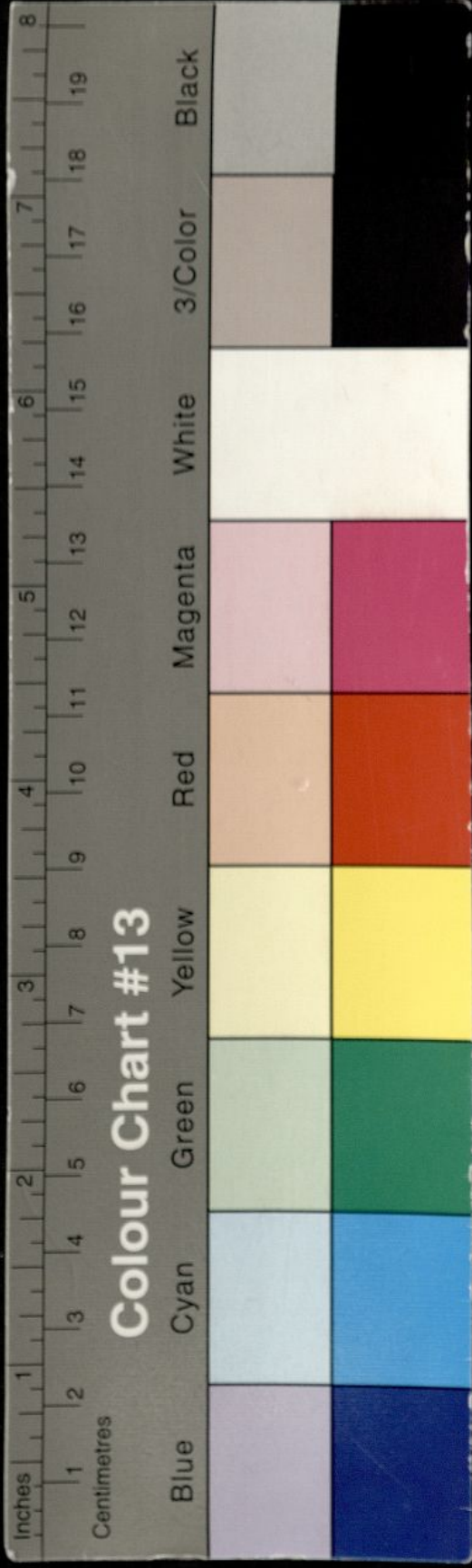
Colour Chart #13