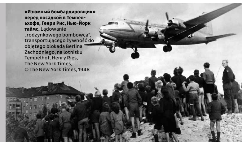
«Изюмный бомбардировщик» перед посадкой в Темпельхофе, Генри Рис, Нью-Йорк таймс, Ładowanie „rodzynkowego bombowca”, transportującego żywność do objętego blokadą Berlina Zachodniego, na lotnisku Tempelhof, Henry Ries, The New York Times, © The New York Times, 1948