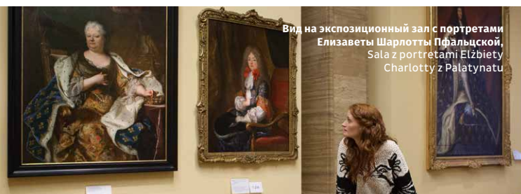
Вид на экспозиционный зал с портретами Елизаветы Шарлотты Пфальцской, Sala z portretami Elżbiety Charlotty z Palatynatu