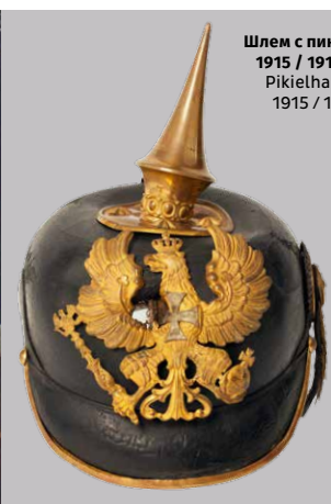
Шлем с пикой, 1915 / 1916 г., Pikielhauba 1915 / 1916