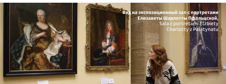
Widok na ekspozycyjny zsal z portretami Elżbiety Szarloty Palatynki, Sala z portretami Elżbiety Charlotte z Palatynatu