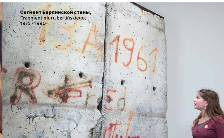
Сегмент Берлинской стены, Fragment muru berlińskiego, 1975 / 1990