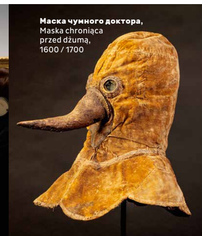
Маска чумного доктора, Maska chroniąca przed dżumą, 1600 / 1700