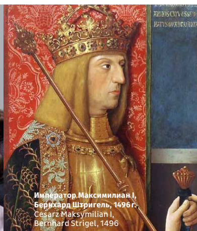
Император Максимилиан I, Бернхард Штригель, 1496 г., Cesarz Maksymilian I, Bernhard Strigel, 1496