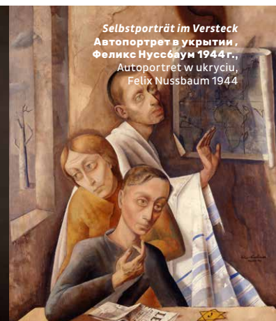
Selbstporträt im Versteck Автопортрет в укрытии, Феликс Нуссбаум 1944 г., Autoportret w ukryciu, Felix Nussbaum 1944