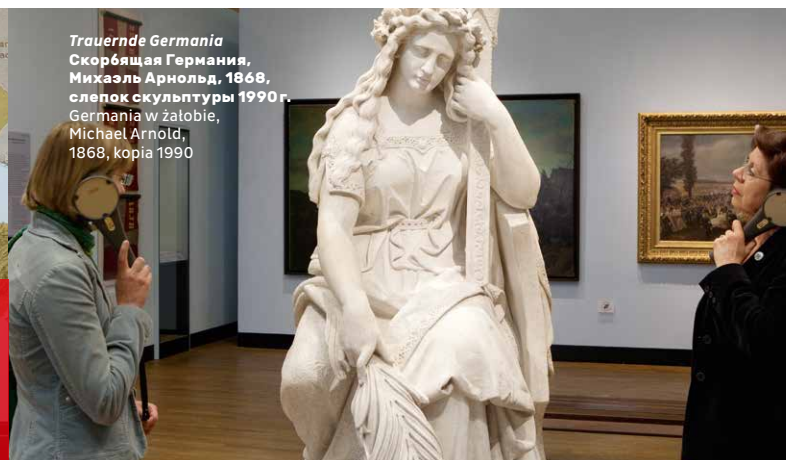
Trauernde Germania Скорбящая Германия, Михаэль Арнольд, 1868, слепок скульптуры 1990 г. Germania w żałobie, Michael Arnold, 1868, kopia 1990