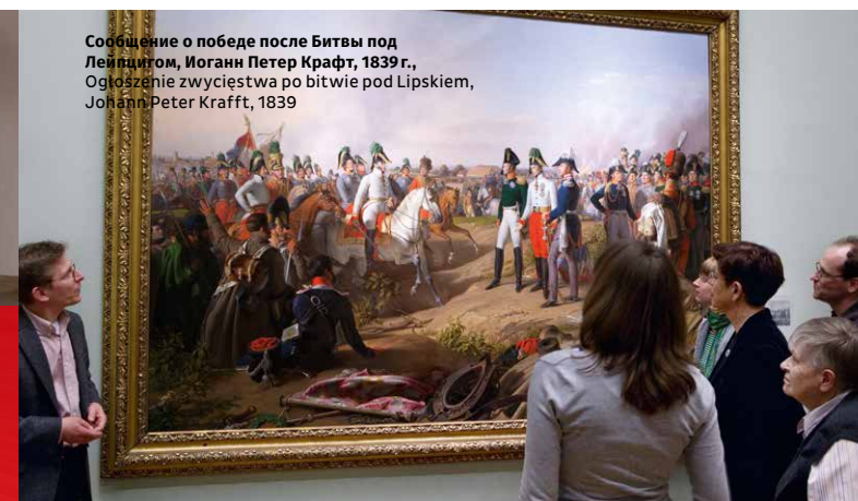
Сообщение о победе после Битвы под Лейпцигом, Иоганн Петер Крафт, 1839 г., Ogłoszenie zwycięstwa po bitwie pod Lipskiem, Johann Peter Krafft, 1839