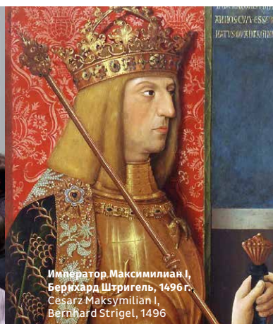
Император Максимилиан I, Бернхард Штригель, 1496 г., Cesarz Maksymilian I, Bernhard Strigel, 1496