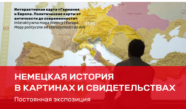
Интерактивная карта «Германия и Европа. Политические карты от античности до современности» Interaktywna mapa Niemcy i Europa. Mapy polityczne od starożytności do dziś