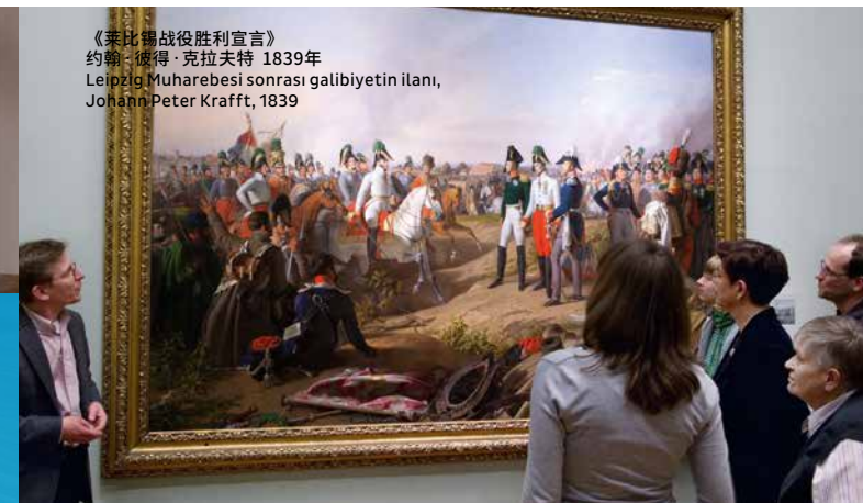
《莱比锡战役胜利宣言》 约翰·彼得·克拉夫特 1839年 Leipzig Muharebesi sonrası galibiyetin ilanı, Johann Peter Krafft, 1839