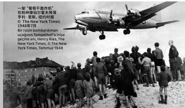
一架“葡萄干轰炸机” 在柏林滕珀尔霍夫降落 亨利·里斯, 纽约时报 © The New York Times 1948年7月 Bir rosin bombardıman uçacağının Tempelhof'a inişe geçme anı, Henry Ries, The New York Times, © The New York Times, Temmuz 1948