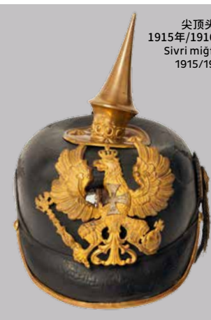
尖顶头盔 1915年/1916年 Sivri miğfer, 1915/1916