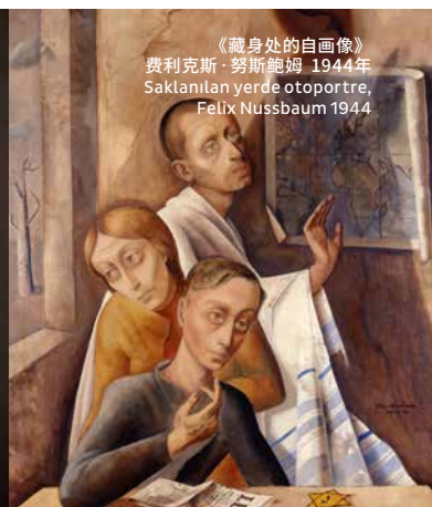
《藏身处的自画像》 费利克斯·努斯鲍姆 1944年 Saklanılan yerde otoportre, Felix Nussbaum 1944