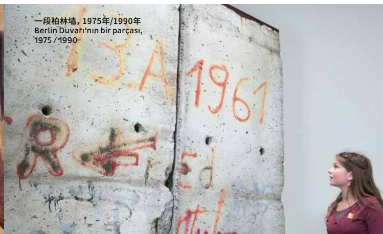
一段柏林墙, 1975年/1990年 Berlin Duvarı'nın bir parçası, 1975 / 1990

德国历史博物馆“德意志历史图片与文献展”常设展, 坐落在军械库(Zeughaus)这座菩提树下大街最古老、柏林最著名的巴罗克式建筑中。展览占两个楼层, 按年代顺序, 以国际关系为背景, 介绍德意志历史。参观者在了解那些跨纪元的历史事件、划时代的统治者和政治家的同时, 有机会窥见德意志城市与乡村的日常生活, 德国历史也在这个拥有7000多件重要展品的独特展览中获得充分而生动的展现。