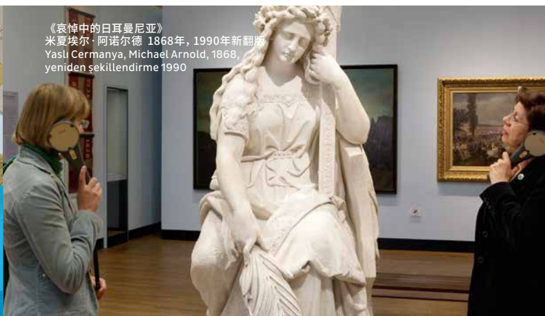
《哀悼中的日耳曼尼亚》 米夏埃尔·阿诺尔德 1868年, 1990年新翻版 Yaslı Cermanya, Michael Arnold, 1868. yeniden şekillendirme 1990