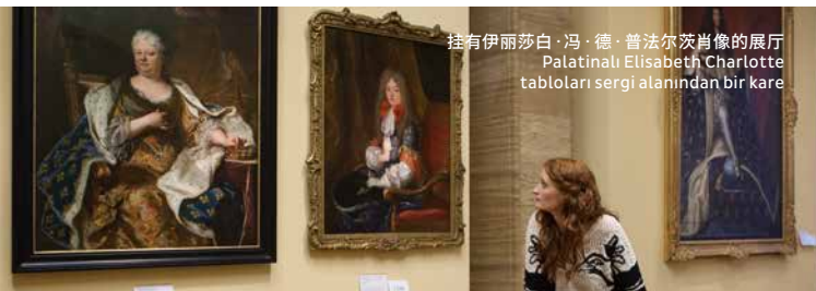
挂有伊丽莎白·冯·德·普法尔茨肖像的展厅 Palatinal Elisabeth Charlotte tabloları sergi alanından bir kare