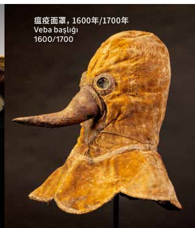
瘟疫面罩, 1600年/1700年 Veba başlığı 1600/1700