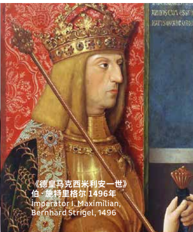
《德皇马克西米利安一世》 伯·施特里格尔 1496年 Imperator I. Maximilian, Bernhard Strigel, 1496