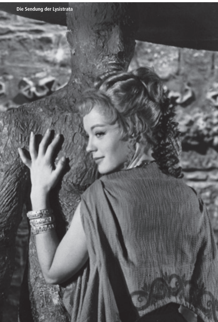
Die Sendung der Lysistrata