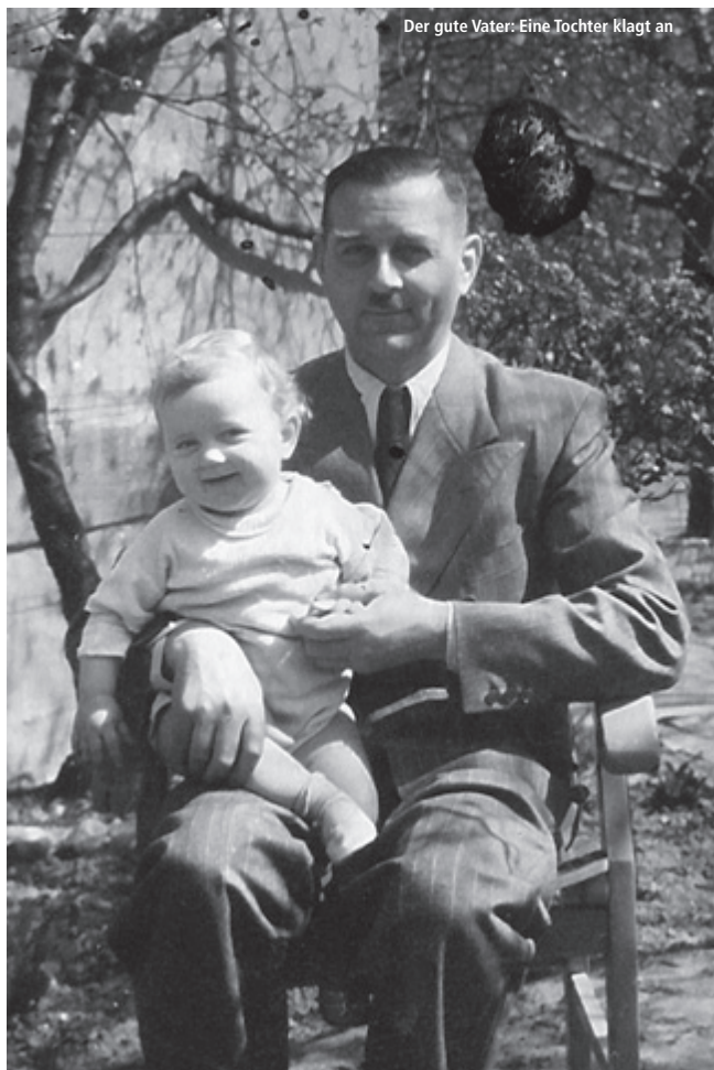
Der gute Vater: Eine Tochter klagt an

Die Polizei war ein zentrales Herrschaftsinstrument des NS-Regimes. Nicht nur die Gestapo, sondern auch alle anderen Sparten der deutschen Polizei waren am Terror gegen die politischen und weltanschaulichen Gegner der Nationalsozialisten beteiligt, zunächst im Inneren des Deutschen Reiches und seit Kriegsbeginn 1939 schließlich in allen von der Wehrmacht eroberten Gebieten. Mehrheitlich in der Weimarer Republik sozialisiert und ausgebildet, beteiligten sich deutsche Polizisten massenhaft an Verbrechen. Nur wenige mussten sich nach 1945 vor Gericht verantworten. Viele konnten in der Bundesrepublik ihre Karrieren im Polizeidienst fortsetzen. Ab dem 1. April ist im Deutschen Historischen Museum die Ausstellung ORDNUNG UND VERNICHTUNG – DIE POLIZEI IM NS-STAAT zu erleben, die das Zeughauskino mit einer Filmreihe begleitet. Neben Dokumentarfilmen, die vor allem die verschlungenen Lebenswege ehemaliger Polizeibeamter erforschen, steht mit drei Spielfilmen aus der Zeit des »Dritten Reichs« auch die Funktion des Kriminalfilms im NS-Staat zur Diskussion.