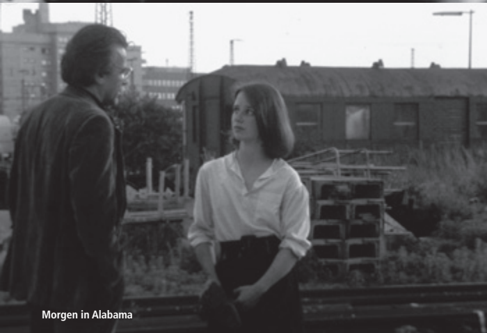
Morgen in Alabama