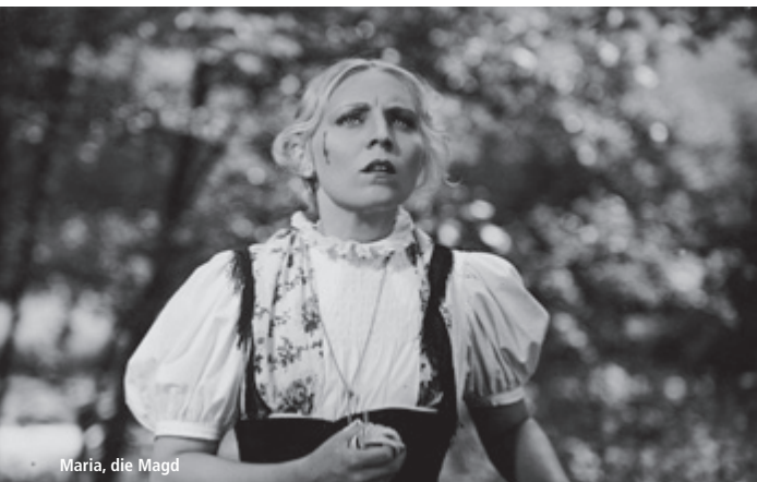
Maria, die Magd