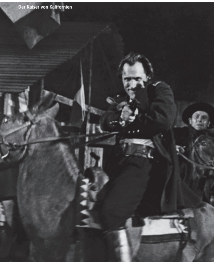
Der Kaiser von Kalifornien

Eine Veranstaltungsreihe in Zusammenarbeit mit CineGraph Babelsberg, dem Bundesarchiv-Filmarchiv und der Deutschen Kinemathek – Museum für Film und Fernsehen