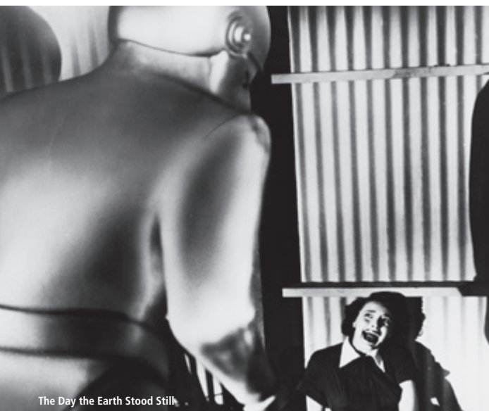
The Day the Earth Stood Still