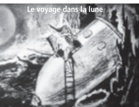
Le voyage dans la lune