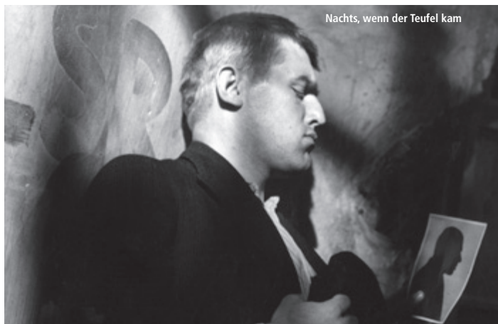
Nachts, wenn der Teufel kam