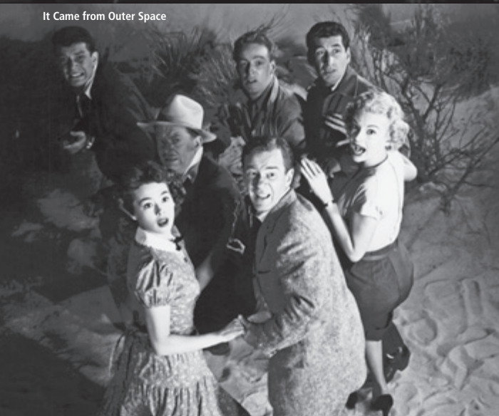
It Came from Outer Space