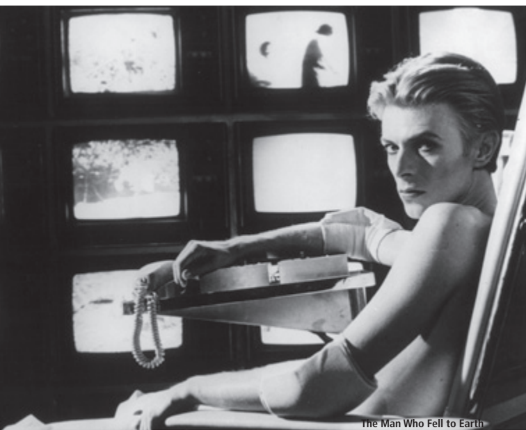
The Man Who Fell to Earth