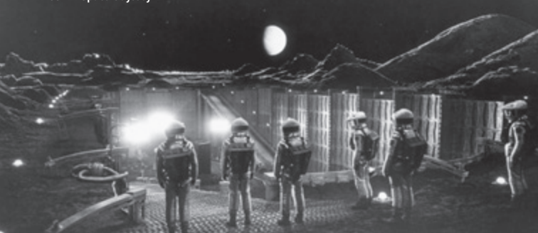
2001: A Space Odyssey