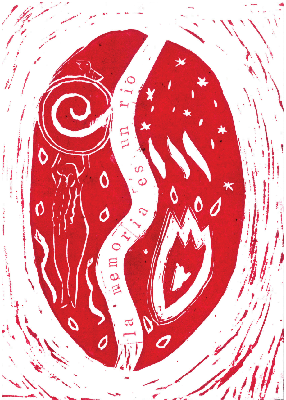
La memoria es un rio - Das Gedächtnis ist ein Fluss Bildungszentrum Lohana Berkins