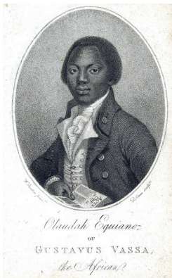
Olaudah Equiano (ca. 1745–1797)

Creemos que hoy en día, vivimos en un mundo sin perspectiva; el futuro se asocia con el caos y la destrucción, a diferencia del Siglo de las Luces, cuando se creía firmemente que a través de la educación, la ilustración y el progreso, el mundo y las personas podrían evolucionar. Y el límite era el cielo.