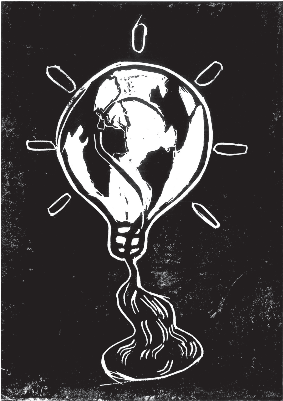
Sin título - Ohne Titel Bildungszentrum Lohana Berkins