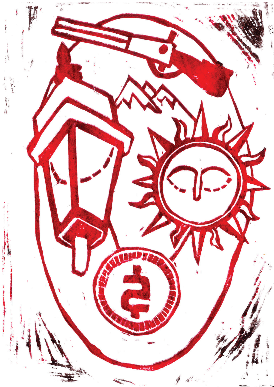
Sin título - Ohne Titel Bildungszentrum Lohana Berkins