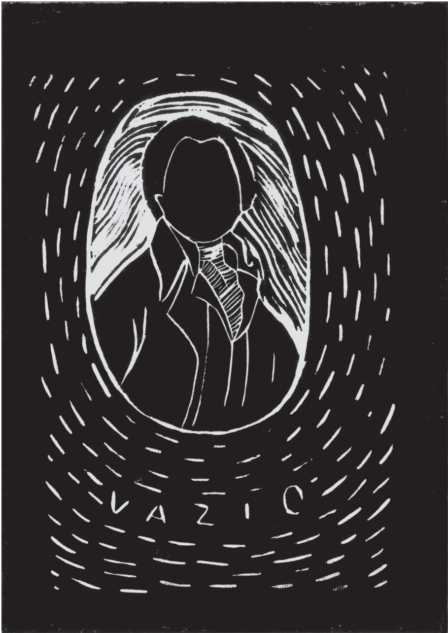
Vazio - Die Leere Bildungszentrum Lohana Berkins