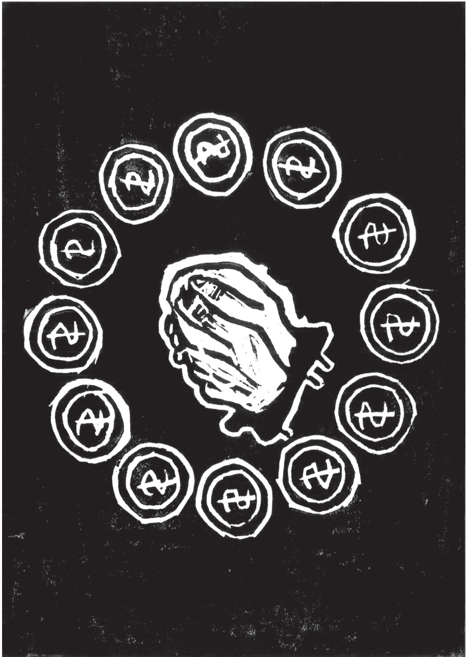
Sin título - Ohne Titel Bildungszentrum Lohana Berkins