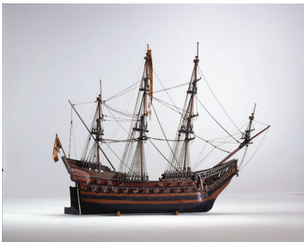
Schiffsmodell der kurbrandenburgischen Fregatte „Friedrich Wilhelm zu Pferde“.

Im Rahmen des Aufklärung NOW Festivals am 22. November 2024 wird ein breiteres Publikum eingeladen, den begonnenen kreativen Prozess fortzuführen und unter der Anleitung von Mitarbeiter*innen des Bildungszentrums Lohana Berkins eigene Linolschnitte anzufertigen sowie Texte zu schreiben.