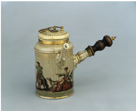
Schokoladenkännchen mit Jagdmotiven, Königliche Porcellain Fabrique, Meißen ca. 1745

Wie sollten wir über Kolonialismus, Rassismus sprechen ..., ohne Raum zu haben?