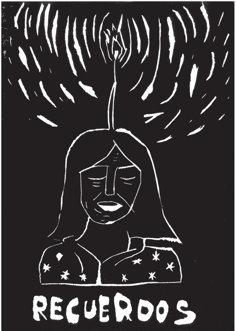
Recuerdos - Erinnerungen Bildungszentrum Lohana Berkins