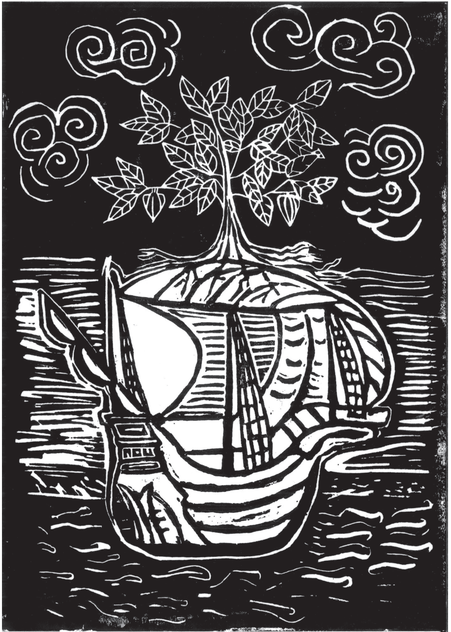
Sin título - Ohne Titel Bildungszentrum Lohana Berkins