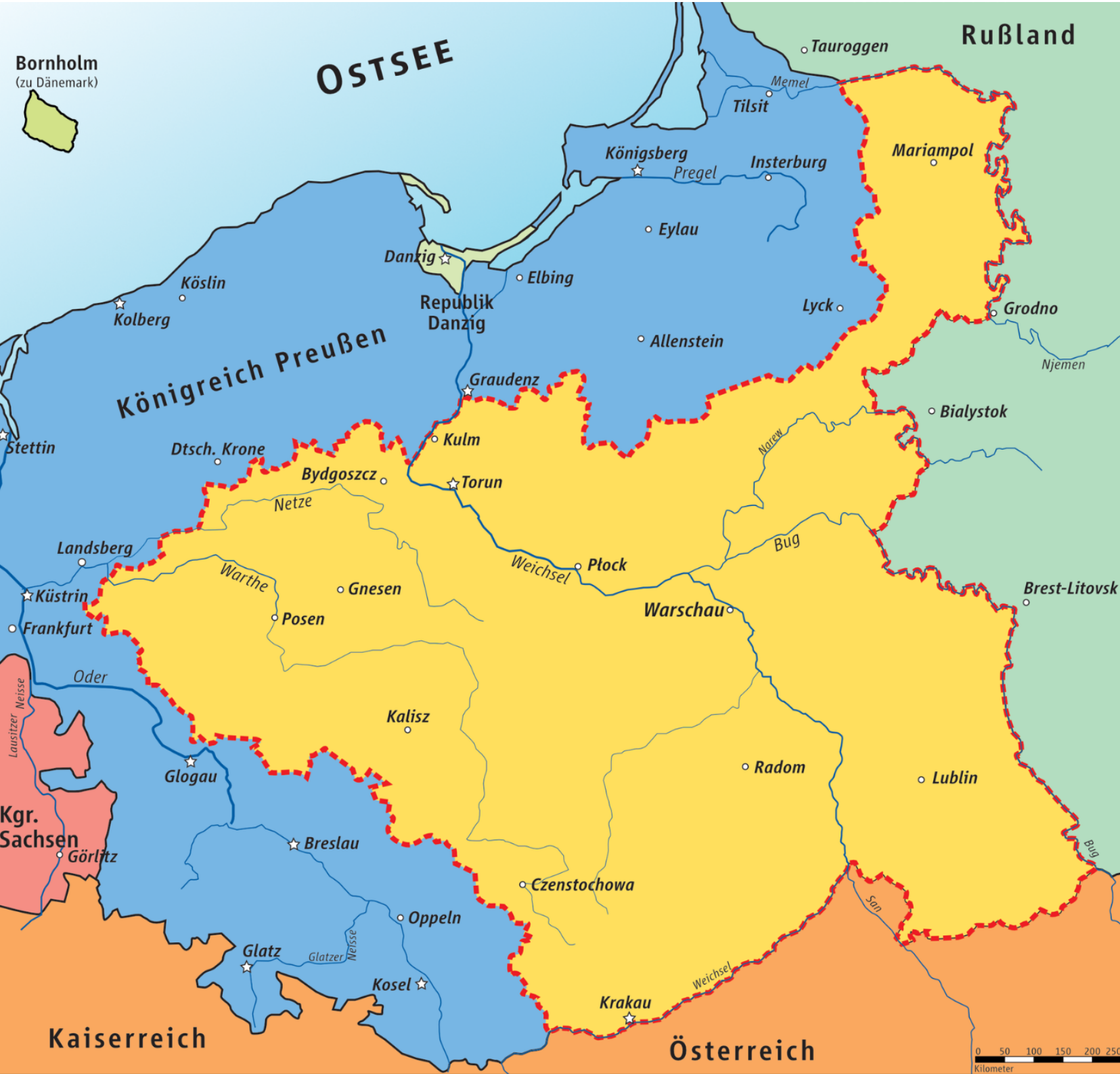
Karte des Herzogtums Warschau 1809