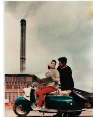
Kurt Schwarzer Paar mit Motorroller vor dem Kraftwerk Vockerode, 1963

Titelbild der Frauenzeitschrift „Für Dich“ (Heft 18/1963)