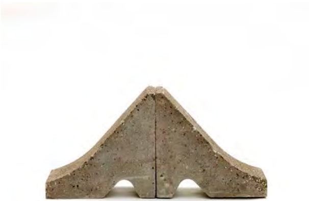
19 Zwei ehemalige Markierungssteine der Grenze, Neustraße/Nieuwstraat, Herzogenrath (D)/Kerkrade (NL), 1968/1993, Prefab-Gussbeton