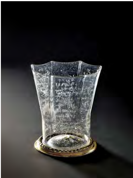
13 Willkomm-Becher der Grafen Oettingen, sog. Oettingen-Willkomm, Süddeutschland, 1520/1530, farbloses Glas, Gravuren 1548-1650, Glas, farblos, graviert; Silber, vergoldet, graviert