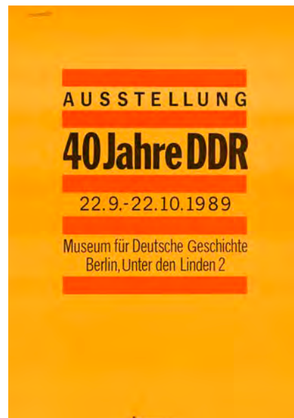
8 Ausstellungsplakat „40 Jahre DDR“, Druckerei: Neues Deutschland, Ost-Berlin, 1989