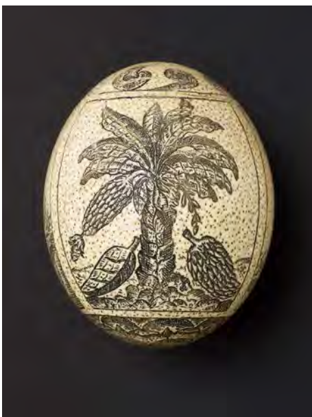
15 Graviertes Straußenei mit Motiven aus Jan Huygen van Linschotens Itinerario, Niederlande, ca. 1600/1620, Straußenei, geritzt, graviert, geschwärzt