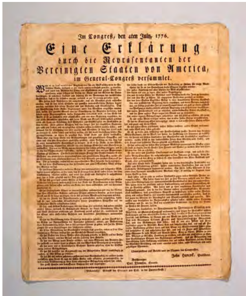
5 Erstdruck der amerikanischen Unabhängigkeitserklärung in deutscher Sprache, Verfasser: Thomas Jefferson et al.; Übersetzer: Charles Cist, Philadelphia, 6.–8.7.1776, Papier © DHM

Eine Ausstellung des Deutschen Historischen Museums 8. Mai 2026 bis 31. Oktober 2027