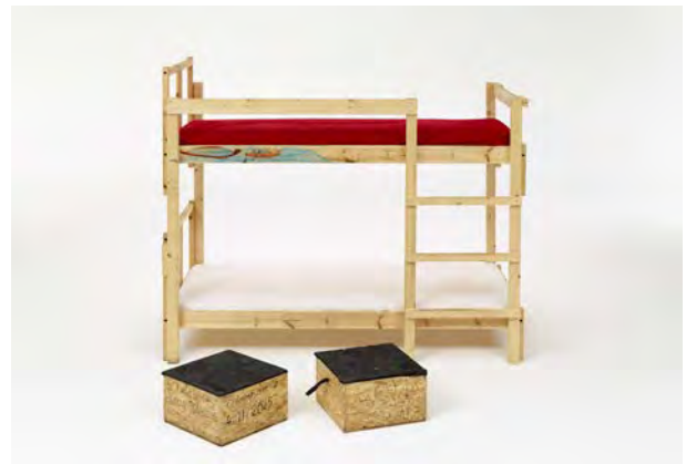
22 Doppelstockbett für Geflüchtete und zwei Privacy-Boxen, zwei Holzbetten des Herstellers Ikea, Modell Fjellse, Kassel, 2015, Kiefernholz, beschrieben, bemalt