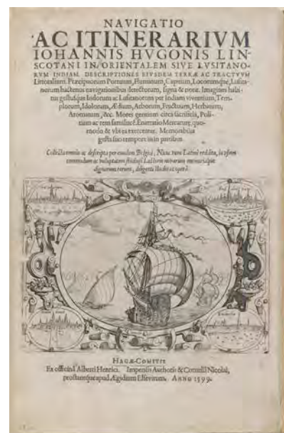
16 Titelblatt der Reisebeschreibung des niederländischen Seereisenden Jan Huygen van Linschoten nach Indien, lateinische Erstausgabe (Itinerario), Den Haag, 1599