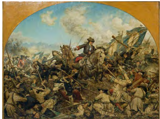
2 Hermann Joseph Wilhelm Knackfuß: Prinz Leopold von Anhalt-Dessau in der Schlacht bei Turin am 7. September 1706, 1884, Öl auf Leinwand