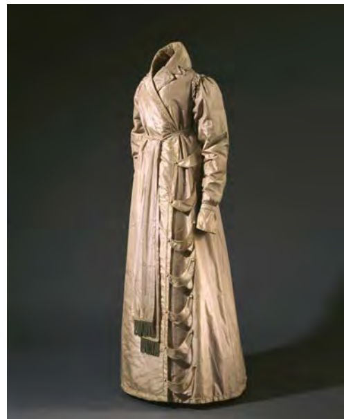
4 Morgenrock der Königin Luise von Preußen, Deutschland oder Frankreich, 1806–1810, Seide, Taft, Posamenten, Metall, Wolle