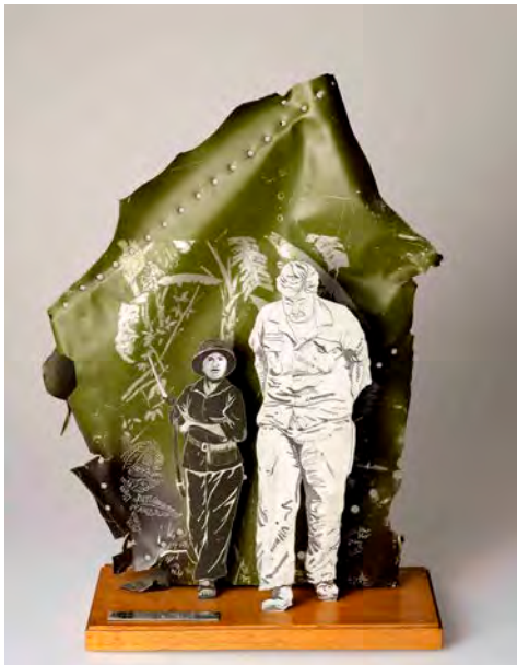
9 Tischzier mit US-Flugzeugwrackteil nach einem Foto aus dem Vietnamkrieg, Vietnam, 1967–1975, Holz, Aluminium, graviert