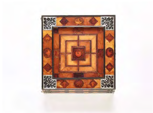
14 Brettspielkassette für Mühle, Schach und Tric-Trac, ehemals im Besitz der Anna von Dänemark, datiert ‚5. Aprilis.1607‘, Bernstein, Elfenbein, Metallfolie, Ebenholz, Silber