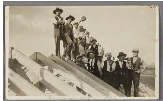
20 Wandergesellen der Vereinigung der rechtschaffenen fremden und einheimischen Zimmer- und Schieferdecker- und Bauarbeiter auf dem Dachstuhl eines Gebäudes, datiert „Oktober 1926“, Silbergelatinabzug