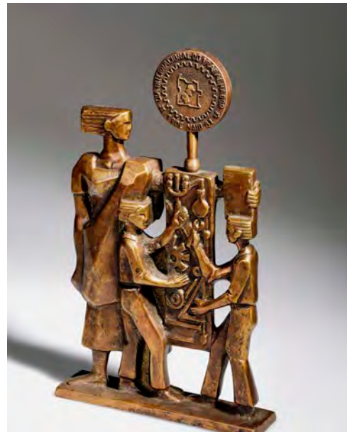
10 Tischzier zum internationalen Tag der Arbeit am 1. Mai, Portugal, Mai 1981, Messing, gegossen