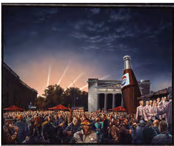
11 Matthias Koeppel: ... und alles wird wieder gut. Der 3. Oktober 90 vor der Neuen Wache, Berlin, 1991, Öl auf Leinwand © VG Bild-Kunst, Bonn 2026