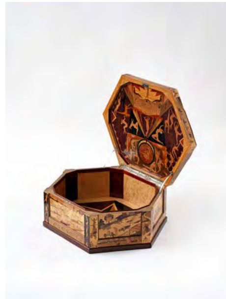
18 Hexagonale Truhe mit einem Modell des Deutschen Stadions in Berlin-Charlottenburg, Gustav Baumann, Berlin/Potsdam, 1912 (Modell), 1923/24 (Truhe), Edelhölzer, markiert