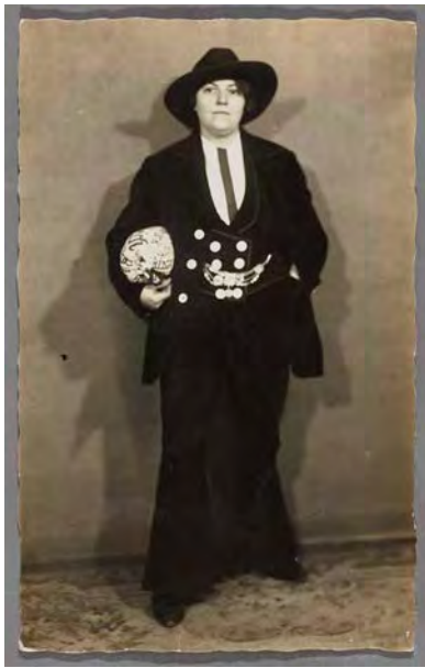
21 Frau in der Kluft eines Handwerksgesellen mit Reisebündel, Köln, datiert „Karneval 1929“, Silbergelatineabzug