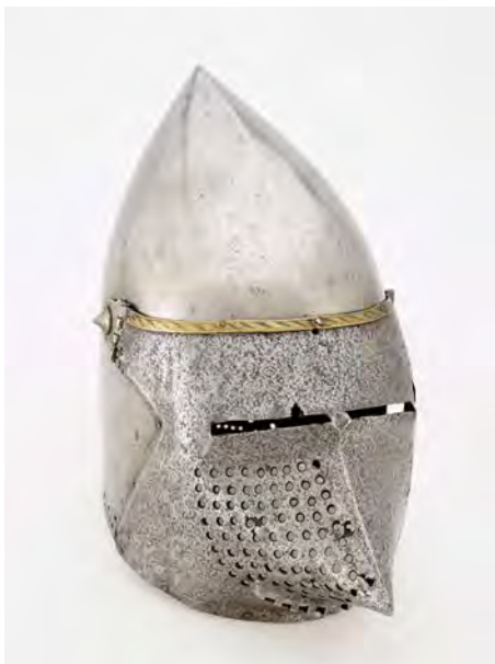
3 Hundsgugel, Norditalien, um 1360, Eisen, Messing