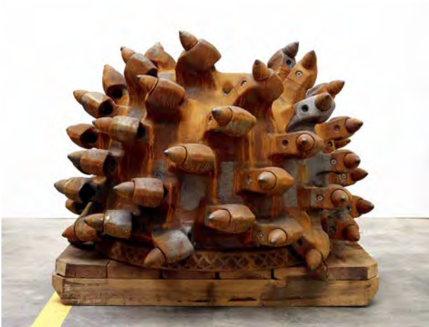
17 Querschneidkopf (Schrämkopf) einer Teilschnittmaschine, Voestalpine AG, Österreich, 2003/2016, Stahlguss, geschraubt