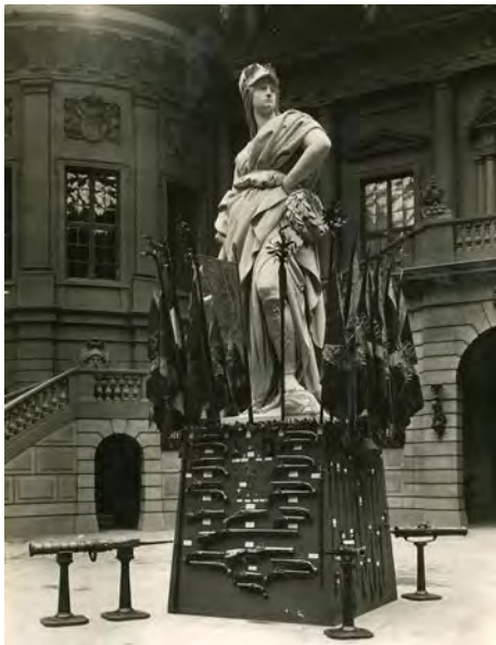
1 Ausstellung von Neuerwerbungen der Jahre 1910/11 im Zeughaus anlässlich des Geburtstags Kaiser Wilhelms II., August Scherl Illustrations-Centrale G.m.b.H., Berlin, 1912 © DHM