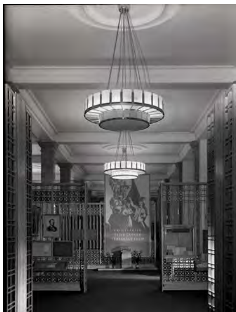
7 Das Kommunistische Manifest in der ersten Sonderausstellung „Karl Marx“ im Museum für Deutsche Geschichte, Ost-Berlin, 1955