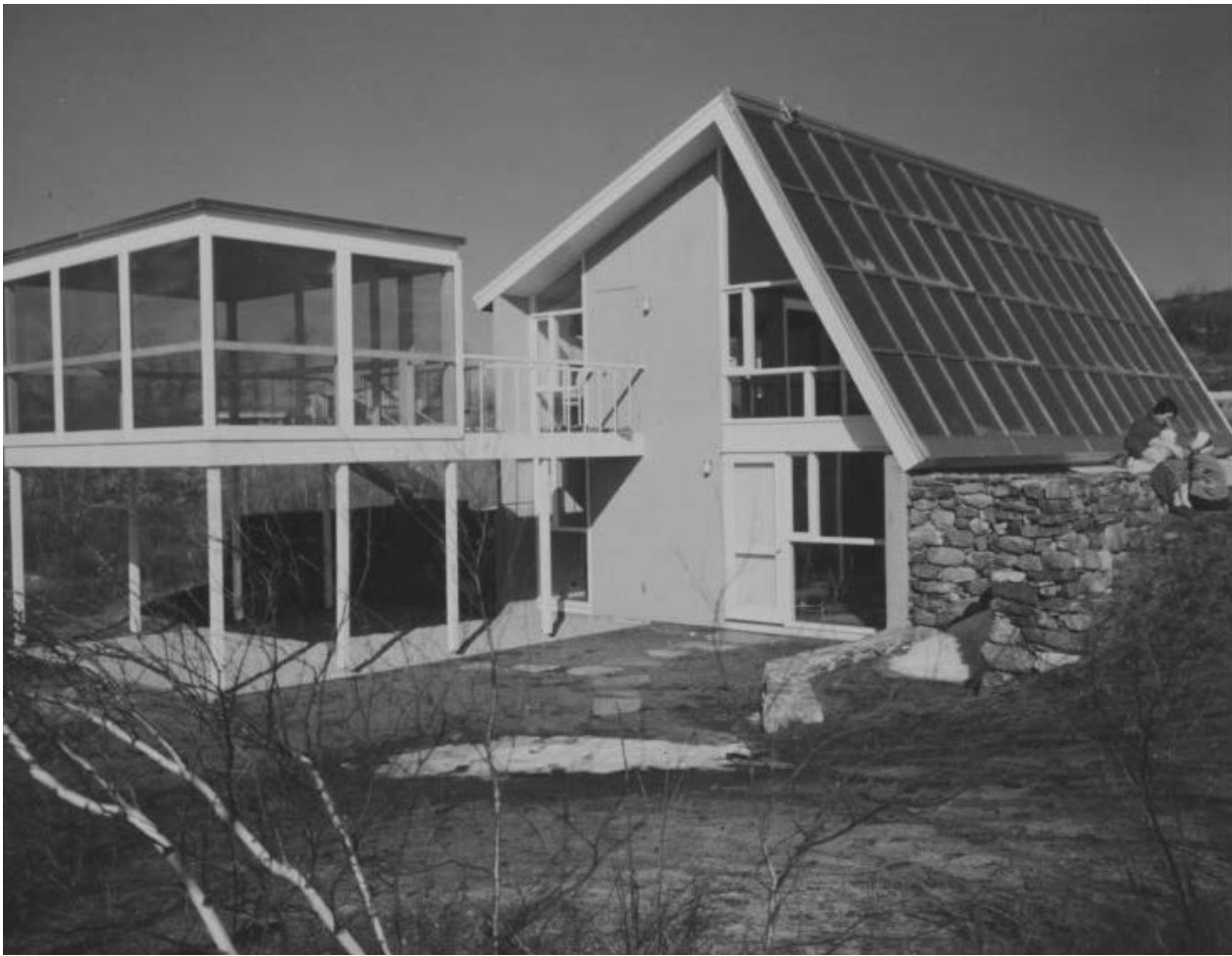
Für den Massenbau geplantes Solarhaus des Massachusetts Institute of Technology (MIT), Lexington, USA, 1958