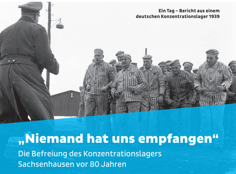
Ein Tag – Bericht aus einem deutschen Konzentrationslager 1939