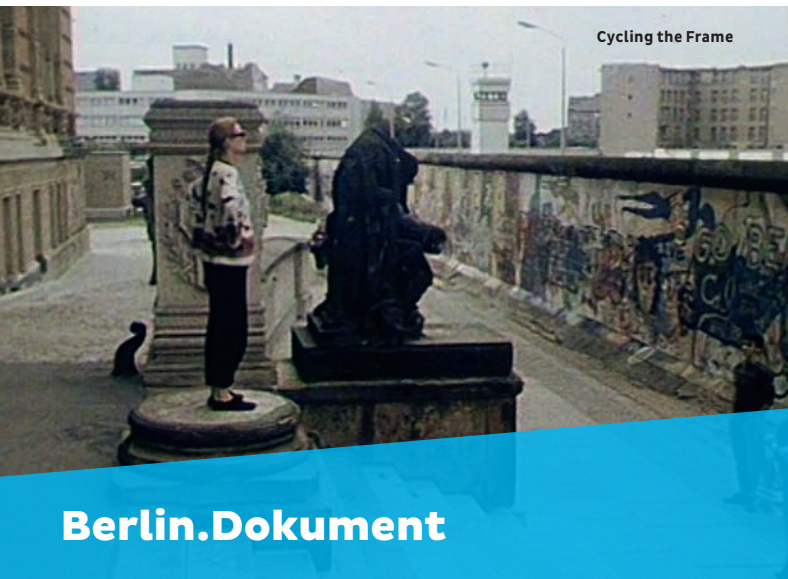
Cycling the Frame