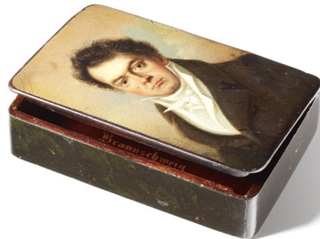
Stobwasser's Fabrik, Lackdose mit dem Bildnis Ludwig van Beethovens, um 1825

Wahrnehmung I, Wahrnehmung II, Unendlichkeit, Aufklärung, Revolution, Heldentum, Befreiung, Einigung, Konformität