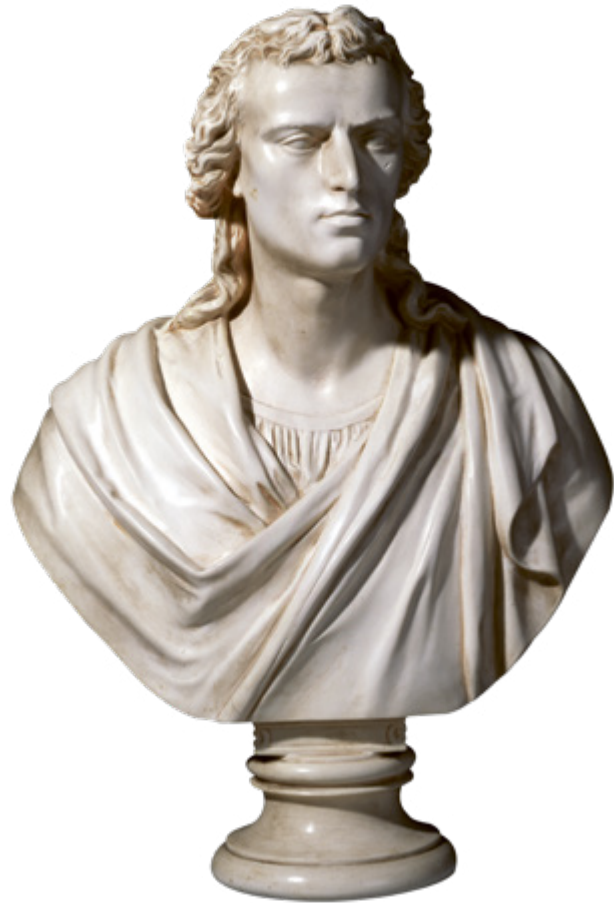
Фридрих фон Шиллер, оригинальная скульптура 1808/1810 года, воссоздана в 1994 году Фридрих фон Шиллер (1759–1805) – выдающийся немецкий поэт, историк и критик, жил и работал в Штутгарте, Дрездене и Йене, в 1799 году переехал в Веймар. Наряду с Гете считается основоположником немецкой классической литературы.