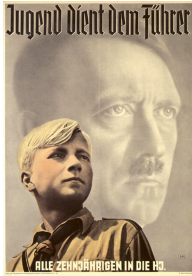
Плакат, призывающий вступать в гитлерюгенд, прим. 1939 год: «Молодёжь служит фюреру: все, кому исполнилось 10 лет, в гитлерюгенд». Пропагандистская машина нацистской Германии стремилась привлечь детей и подростков в юношеские и молодежные нацистские организации, чтобы воспитать их убежденными национал-социалистами.

Стоимость доставки 6€ (в Германии), 9€ (в другие страны)