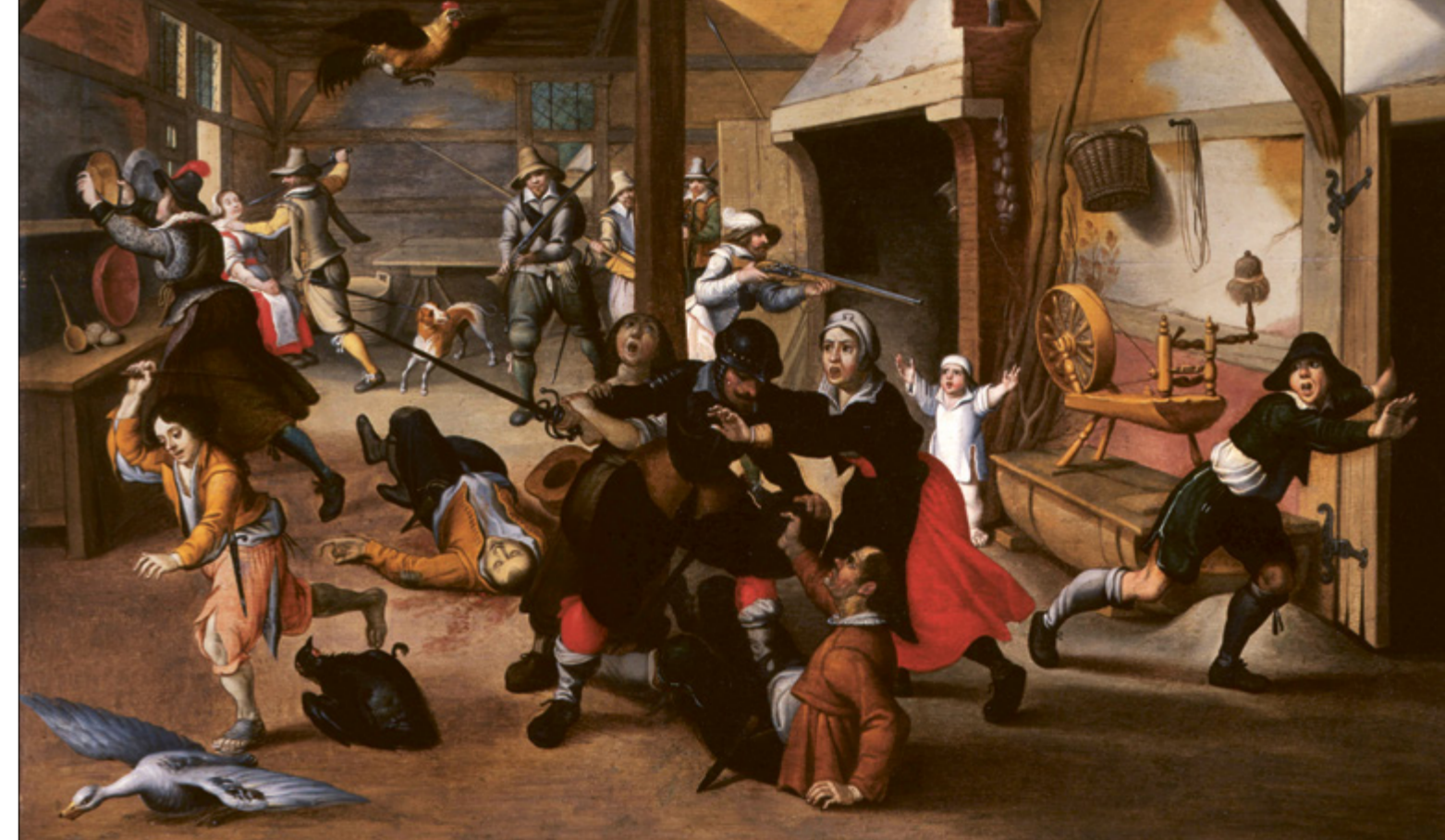
Солдаты грабят крестьянскую усадьбу, прим. 1620 год Мародерство было обычным явлением Тридцатилетней войны. Высокий уровень детализации, присущий картине Себастьяна Вранкса, делает ее гнетущим свидетельством жестоких преступлений против мирного населения.