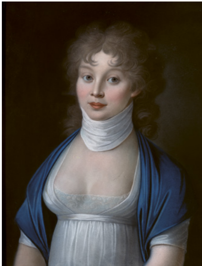
Королева Пруссии Луиза, 1799 год Луиза Мекленбург-Стрелицкая (1776–1810) стала супругой прусского кронпринца Фридриха Вильгельма III (1770–1840), в их браке родилось девять детей. Королева с самого начала завоевала любовь народа. А встреча с Наполеоном, во время которой она просила смягчить унижительные для Пруссии условия мирного соглашения, и ранняя смерть Луизы, возвели ее в ранг культовой исторической личности.

7000 уникальных исторических экспонатов рассказывают о выдающихся личностях, идеях, событиях и исторических процессах. Основной акцент сделан на политической истории Германии, которую определяли правители, политики и сообщества. Кроме того здесь представлены дополнительные экспозиции, посвященные повседневной жизни разных социальных слоев и групп той или иной эпохи.