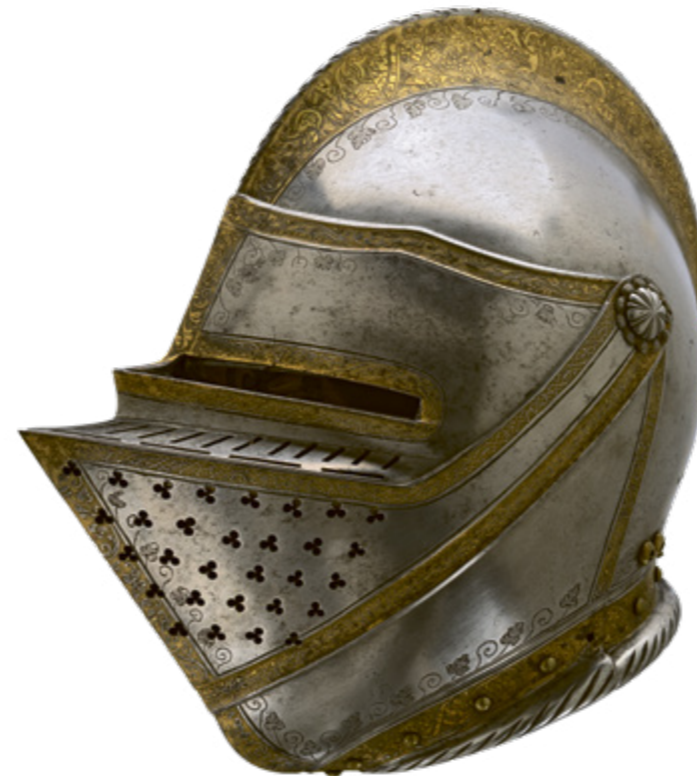
Закрытый шлем французского короля Франциска I, прим. 1539 / 1540 год Этот шлем являлся частью комплекта доспехов, включавшего в себя турнирные доспехи и кирасу для боевых сражений. Доспехи были изготовлены в 1539 году по заказу эрцгерцога Фердинанда I в качестве подарка французскому королю.