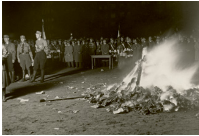
Сожжение книг в Гамбурге на набережной Кайзера Фридриха, 15 мая 1933 года 15 и 30 мая 1933 года в Гамбурге Немецким студенческим союзом и Национал-социалистическим союзом студентов Германии было осуществлено демонстративное сожжение книг. Это событие стало апогеем акции, инициированной Департаментом прессы и пропаганды Немецкого студенческого союза, которая была направлена против инакомыслящих философов, писателей и публицистов.